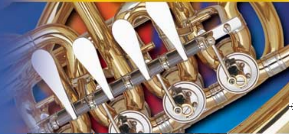
Modell 56L „Oval“